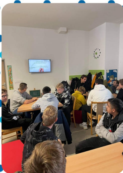
Beseda Informační a mediální gramotnost v Městské knihovně Kyjov