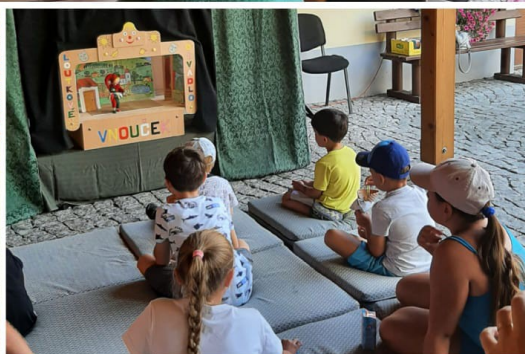
Barevné léto s íčkem v Městské knihovně Kyjov