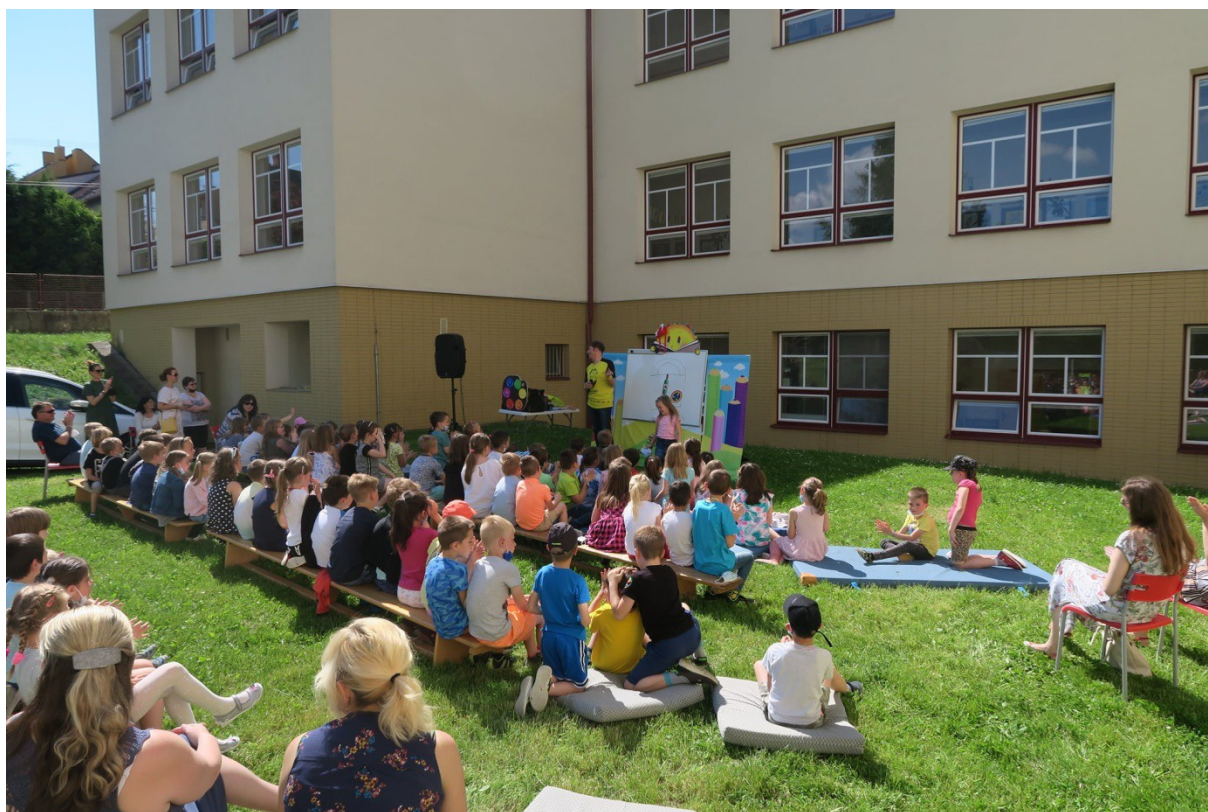
Pasování prvňáčků v Městské knihovně Kyjov s doprovodným programem A. Dudka

V Městské knihovně v Kyjově se podařilo akci udržet i přes jistá omezení, díky pěknému počasí mohlo setkání se všemi prvňáčky z Kyjovských škol proběhnout venku. Děti čekalo oficiální "pasování na čtenáře knihovny" s doprovodným programem, rozdávaly se knížky z projektu a nechyběla ani návštěva knihovny.