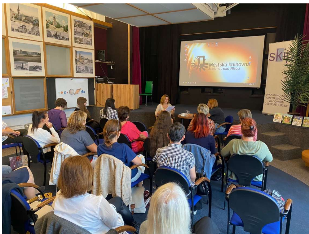
Setkání KDK LK 19. září 2023 v Městské knihovně Jablonec nad Nisou

Setkání bylo zpoplatněno účastnickým poplatkem ve výši 200,-- Kč. Výtěžek byl použit na honorář a cestovné pro přednášející, a občerstvení. Akci finančně podpořila Krajská vědecká knihovna Liberec z dotace na regionální funkce, organizačně se na realizaci podílel RV SKIP a městské knihovny Jablonec nad Nisou, Jičín a Litvínov.