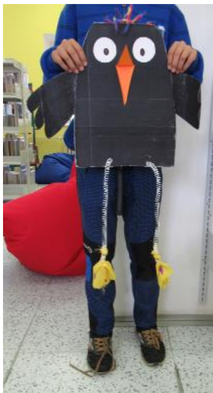
Model kartonového Kamila