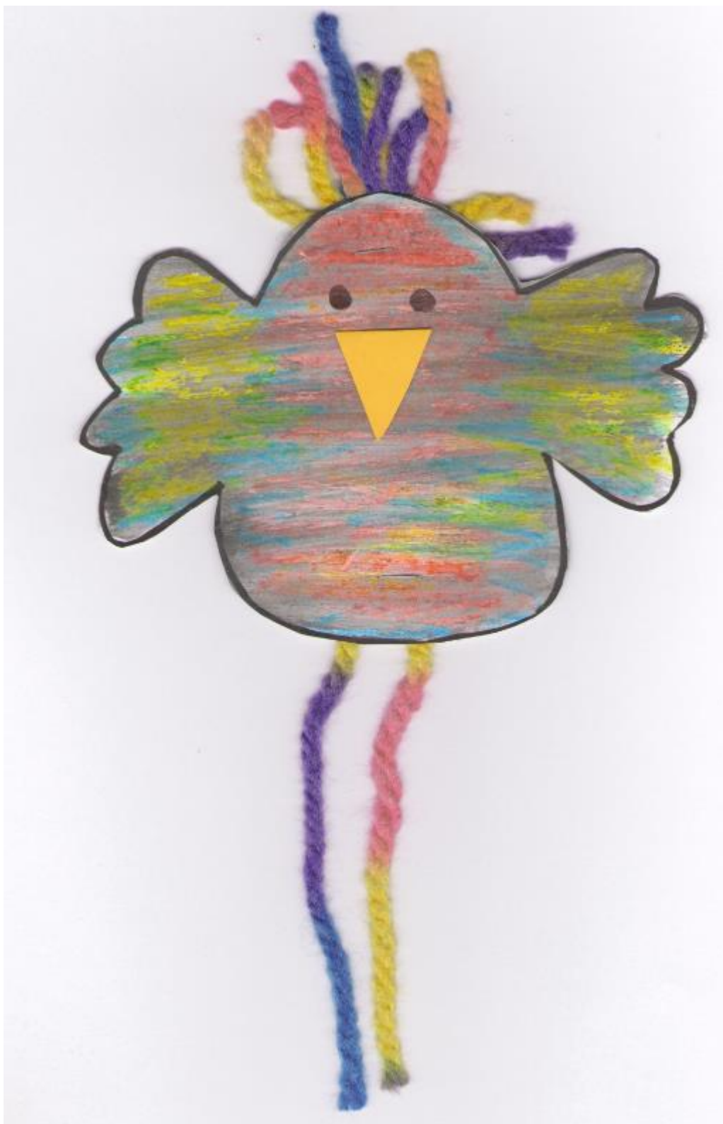
AUTOR: Marcela Fidlerová